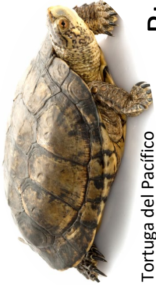
Tortuga del Pacífico